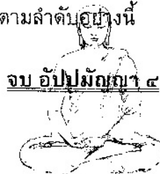
จบ อัมปมกญา ๔ อาหารปฏิภูกลสังญา

พระโพธิสัตว์เมื่อได้แผ่เมตตาและบำเพ็ญบารมี ๑๐ แล้ว ชื่อว่าบำเพ็ญอิฐฐาน ๔ และบรรลุธรรม ๒ อย่าง คือ สมณะและวิปัสสนา ในที่นี้ สัจจาธิฐาน จาคาธิฐาน และอุปสมาธิฐานทำให้สมณะสมบูรณ์ ปัญญาธิฐานทำให้วิปัสสนาสมบูรณ์ เพราะความสมบูรณ์แห่งสมณะ พระโพธิสัตว์เหล่านั้นจึงบรรลุฌาน และยึดมั่นการหลีกออกจากกาม(เนกขัมมบารมี) และมีจิตตั้งมั่นทำให้เกิดสมาธิเพื่อการแสดงยมกปาฏิหาริย์ และมหากรุณาสมบัติ พระโพธิสัตว์เหล่านั้นบรรลुวิปัสสนา ประกอบด้วยอภิปัญญา ปฏิสัมภิชา พละ เวสารัชชะ หลังจากนั้นท่านเหล่านั้นก็ทำปกติญาณและสัพพัญญุตญาณให้เกิดขึ้น พระโพธิสัตว์แผ่เมตตา และบรรลุความเป็นพระสัมมาสัมโพธิญาณ ตามลำดับอย่างนี้