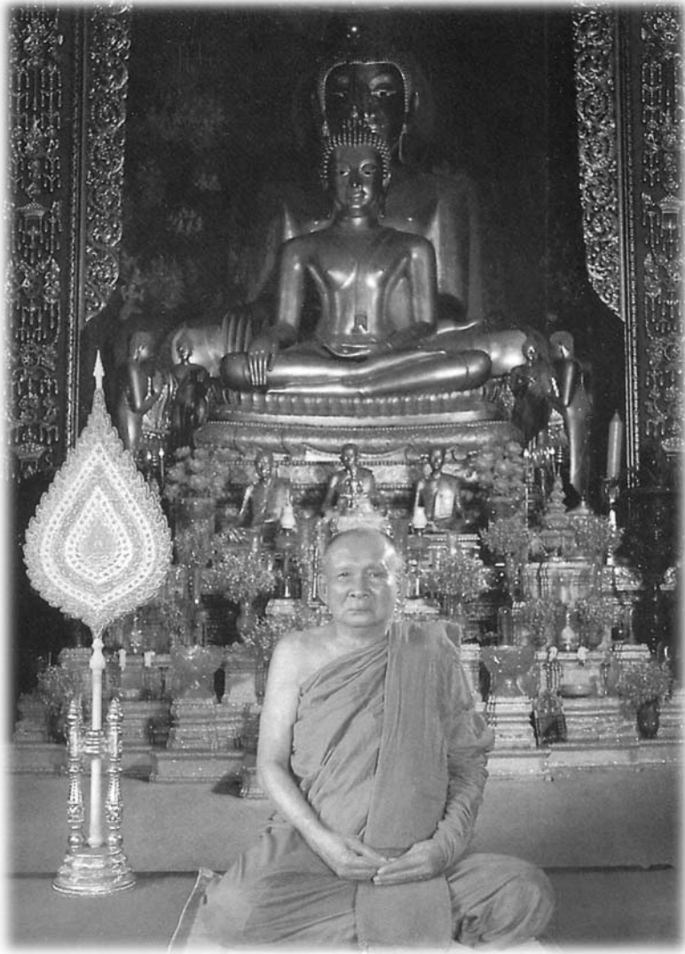
สมเด็จพระญาณสังวร สมเด็จพระสังฆราช สกลมหาสังฆปริณายก วัดบวรนิเวศวิหาร กรุงเทพมหานคร (สมเด็จพระสังฆราช รูปที่ ๑๙ แห่งกรุงรัตนโกสินทร์)