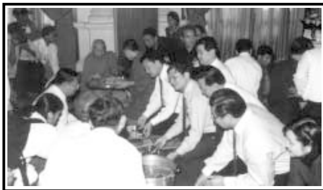
นายกรัฐมนตรี พร้อมคณะรัฐบาล ร่วมกันตักบาตรและถวายจังหันเช้า