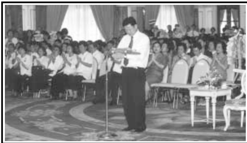
นายกรัฐมนตรี กล่าวคำถวายผ้าป่าช่วยชาติ