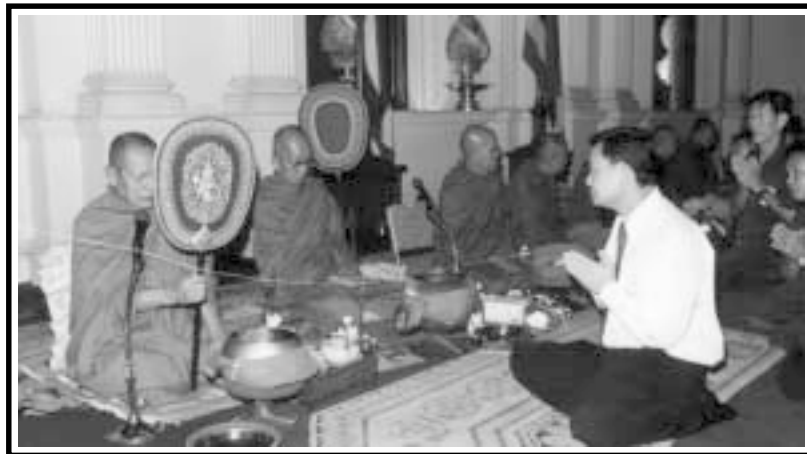
(จากซ้าย) เจ้าพระคุณสมเด็จพระมหาธีรราชจารย์ วัดชนะสงคราม กทม. พระธรรมดิลก วัดเจดีย์หลวง จังหวัดเชียงใหม่ และพ่อแม่ครูอาจารย์พระป่ากรรมฐาน สายหลวงปู่มั่น ภูริทัตโต มาร่วมงานพิธีมอบทองคำ ณ ทำเนียบรัฐบาล

แล้วยิ่งเล่นบัตร์ เล่นเบอร์ เล่นบ้ำ นี่ไปด้วยแล้ว เอ้า! มีเท่าไร ถึงไหนถึงกัน เมื่อคืนนี้ฝันว่าไง ถามกัน ฝัน เมื่อคืนฝันว่าฉัน มันจะ ออกเลขนั้น ถ้าออกเลขนั้น ฟาดไป แล้วเวลาออกแล้วเป็นไง ผิดตัวเดียว เท่านั้น เอาอีกผิดตัวเดียว เอาอีกผิดตัวเดียว แล้วเงินหมดไปเท่าไร มันไม่ได้ว่า ซื่อไปแล้วมันหมดไปเท่าไร แล้วจะเอาอะไร เงินมันหมด ไปแล้ว ไอ้ตู้(ควาย)เราตัวหนึ่งขายได้ราคามาพอสมควร ไปเอามาอีก ไอ้ตู้หมดไปทั้งตัว ผิดเลขตัวเดียวอีก หมดทั้งตู้หมดทั้งตัว ผิดเลข ตัวเดียวอยู่อย่างนั้น สุดท้ายแล้วก็หาเราว่าไง เอานาอีก เป็นไงเฒ่าวันนี้ ผิดตัวเดียวอีก นาไปทั้งทุ่งทั้งแปลง นี่มันพอใจ ถ้าเป็นเรื่องอบายมุข อบายภูมิ มันพอใจ เข้าใจมั๊ย