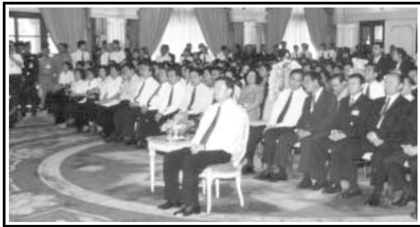
นายกรัฐมนตรี พร้อมคณะรัฐมนตรี ผู้ว่าการธนาคารแห่งประเทศไทย เจ้าหน้าที่ระดับสูง จากกระทรวง ทบวง กรม และทหาร ตำรวจ พ่อค้า ประชาชน มาร่วมงานพิธีมอบทองคำ

เพราะฉะนั้นเราจึงพูดตรง ๆ ใครผิดบอกว่าผิด จะให้เป็น อย่างอื่น เราเป็นไปไม่ได้ ลูบหน้าปะจมูกไม่มีในธรรมทั้งหลาย ต้องให้ ตรงไปตรงมาเลย นี่ก็กำลังช่วยพี่น้องทั้งหลายเต็มเม็ดเต็มหน่วย ตลอดมา และคราวนี้ก็เป็นคราวสำคัญของเราด้วย จะตั้งรากตั้งฐาน ชาติไทยของเราขึ้นจากธรรม พูดง่าย ๆ ว่าธรรม จะเป็นทางบ้านเมือง ก็มีธรรม ไม่มีธรรมยกไม่ได้ ถ้ามีแต่กิเลส แหก ชาติไทยของเราแหก แม้จะอยู่ในวงศานาก็ตาม ถ้าในวงศานาเป็นเปรตเป็นผีแล้ว เปรตผีนี้ ก็ไปทำชาติศาสนาให้จมได้เหมือนกัน คำว่าศาสนา ๆ เป็นจุดศูนย์กลาง ผู้เข้าไปแทรกในศาสนามีทั้งคนดีคนชั่ว ถ้าคนดีเทิดทูนศาสนา แล้วก็ เทิดทูนชาติบ้านเมืองไปได้ ถ้าเป็นคนชั่วแล้วเอาทั้งศาสนาเอาทั้งชาติให้ จมไปด้วยกันก็ได้ มันอยู่กับหัวใจของคนสกปรกและคนสะอาดต่างหาก ให้พากันจำเอาไว้